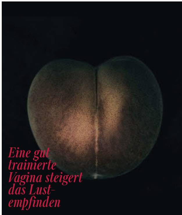
ILLUSTRATION: RETOUCHEE STUDIOS; FOTOS: CERRAHE LAYKIN/TRINK ARCHIVE (3); BILLS PRESS, GETTY IMAGES, ALSTEIN, PR

von ThermiVa, strafft den Vaginal- eingang und gibt dem Beckenboden neue Festigkeit. Störend lange Scham- lippen können so ebenfalls gestrafft werden. Beim Vagina Contouring muss einmal im Jahr nachbehandelt werden.